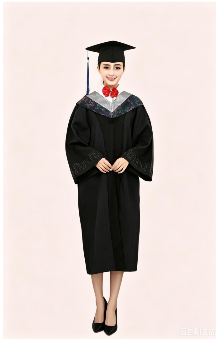
学士学位服穿着示意图

● 内衣：应着白或浅色衬衫。男士系领带，女士可扎领结。 ● 裤子：男士着深色裤子，女士着深色裤子或深、素色裙子。 ● 鞋子：应着深色皮鞋。