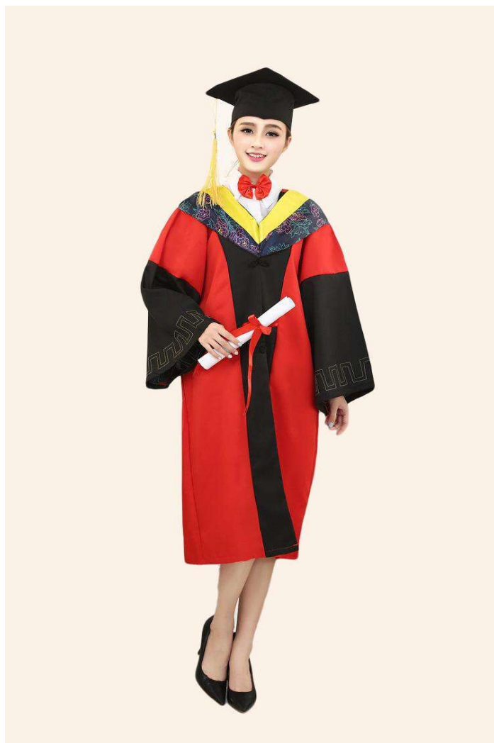
博士学位服穿着示意图

● 内衣：应着白或浅色衬衫。男士系领带，女士可扎领结。 ● 裤子：男士着深色裤子，女士着深色裤子或深、素色裙子。 ● 鞋子：应着深色皮鞋。